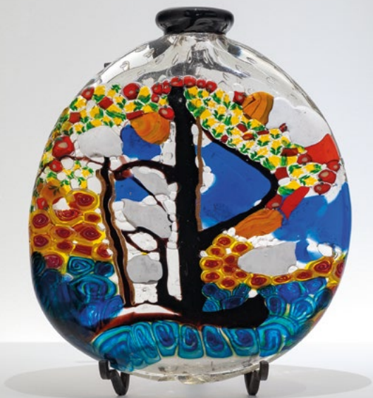
U. Bellotto, Vasi a sezione schiacciata con decoro a murrine, ph. Enrico Fiorese. XIII Biennale 1922, collezione Castello Sforzesco, Milano | XIV Biennale 1924, collezione privata, Treviso.