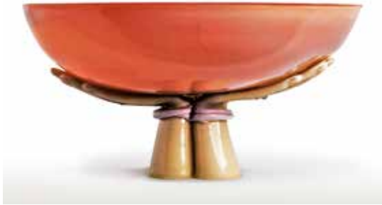
Coppa delle Mani, paste vitree policrome e foglia d'oro. Disegno Buzzi per Venini (1932-1934)

insieme ad architetti e imprenditori come Gio Ponti, Michele Marelli e Paolo Venini. E proprio insieme a Ponti, Tomaso Buzzi è stato uno dei più importanti creatori del gusto italiano degli anni '30 del secolo scorso, dando inizio a un vero e proprio standard imitato da molti negli anni seguenti. Architetto colto, designer curioso, raffinato progettista d'interni, oltre che collaboratore della rivista «Domus», lavorò per le figure più importanti dell'alta borghesia del nostro paese: Volpi, Cini, Visconti, solo per citarne alcuni. Suoi sono ad esempio gli interventi a Villa Necchi Campiglio a Milano, recentemente restaurata dal FAI, alla palladiana Villa Maser a Treviso, a Palazzo Cini a San Vio, Palazzo Papadopoli e Palazzo Labia a Venezia. Tra il 1932 e il 1933 Buzzi avvia