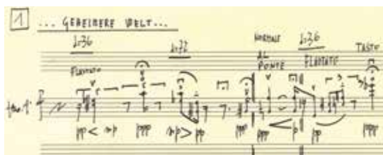
Fragmente - Stille, An Diotima , prima stesura, particolare della pagina 1. Archivio Luigi Nono, Venezia.