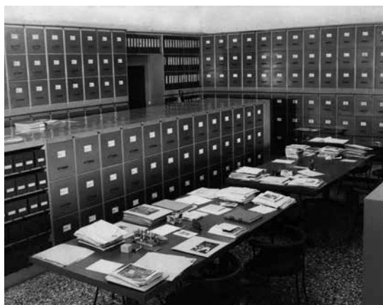
Istituto di Storia dell'Arte e la Fototeca negli anni Cinquanta

Sin dai primi anni, Fiocco impone un forte sviluppo alle pubblicazioni scientifiche, articolate in un ventaglio impressionante di tematiche e concretizzato in tempi 'brucianti': i cataloghi dei musei (poi delle raccolte d'arte) del Veneto, i periodici, le fonti per la storia dell'arte; e, in parallelo, alle rassegne, allestite annualmente a partire dal 1955 – quando presentò al pubblico una scelta di fogli dalla sua collezione – incentrate sul ruolo svolto dal disegno nei processi creativi dei maestri veneti; uniche nel loro genere in Italia a quelle date, se pur usuali nel mondo anglosassone, conferirono da subito a San Giorgio gli onori della critica internazionale.