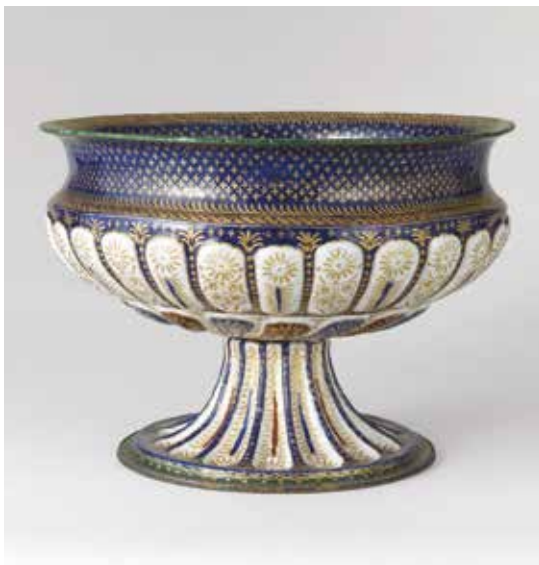
Coppa, inizio del XVI secolo. Parigi, Musée du Louvre

internazionale sulla produzione dei rami smaltati rinascimentali cosiddetti “veneziani”, cui parteciperanno storici dell’arte, conservatori, restauratori insieme a esperti nel campo della diagnostica e delle analisi chimico-fisiche. I rami smaltati rappresentano, tra le arti decorative del Rinascimento italiano, una produzione relativamente limitata ma raffinatissima, tradizionalmente riferita a manifattura veneziana. La maggioranza dei pezzi conservati è formata da servizi da pompa composti principalmente da calici a volte con coperchio, piatti, bacili, saliere, brocche e fiaschi. Vi sono, inoltre, cofanetti, torciere, candelabri e specchi; alcune paci, reliquiari e ostensori attestano anche un uso religioso. Il metallo, che dà la forma all’oggetto, fa da supporto a una decorazione riccamente colorata, e dorata, formata da più strati di smalto con fondi bianchi, blu, viola o verdi, ornati da tocchi di rosso. Ammirati e collezionati nell’Ottocento – periodo in cui si formarono le principali collezioni europee –, questi oggetti, la cui origine risale alla fine del Quattrocento, furono poi dimenticati. Questo convegno interdisciplinare intende approfondire la conoscenza di tali opere di altissima qualità artistica – presenti nei principali musei e collezioni