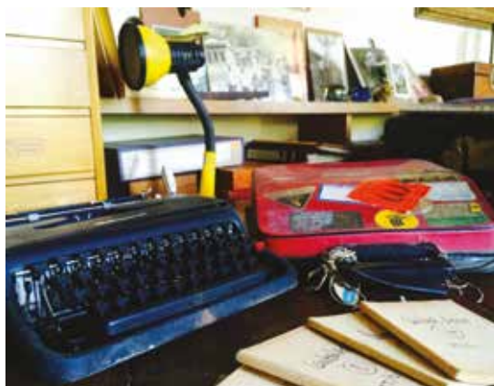
Le macchine da scrivere di Tiziano Terzani