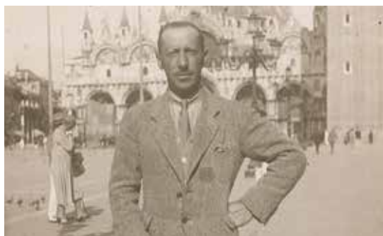
Igor Stravinskij in Piazza San Marco (1925).

22 – 23 SETTEMBRE 2014 VENEZIA, ISOLA DI SAN GIORGIO MAGGIORE