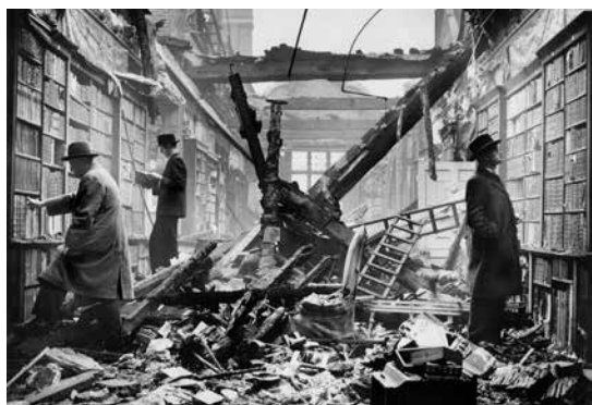
La Holland House Library di Londra dopo il bombardamento aereo del 1940.

a Venezia, per approfondire questioni cruciali riguardanti l'organizzazione della conoscenza nel presente, nel passato e nel futuro. La discussione si concentrerà su alcuni ambiti in cui tali tensioni si sono manifestate e continueranno a manifestarsi: la biblioteca, l'archivio di storia dell'arte e le tecniche della filologia. In tempi di crisi, le interconnessioni tra il contenuto della conoscenza e i modi in cui essa viene prodotta e organizzata sono sottoposte a un'indagine accurata e a una pressione senza precedenti. Diagnosi e prognosi delle crisi attuali sono messe ampiamente in discussione. Alcuni affermano che forme di conoscenza innovative e sperimentali sono ostacolate come non mai dall'insistenza rigida e ostinata sulla specializzazione disciplinare, altri sostengono che la formazione e la competenza disciplinari sono seriamente minacciate dal nozionismo approssimativo insito nell'interdisciplinarietà e nel populismo para-academico.