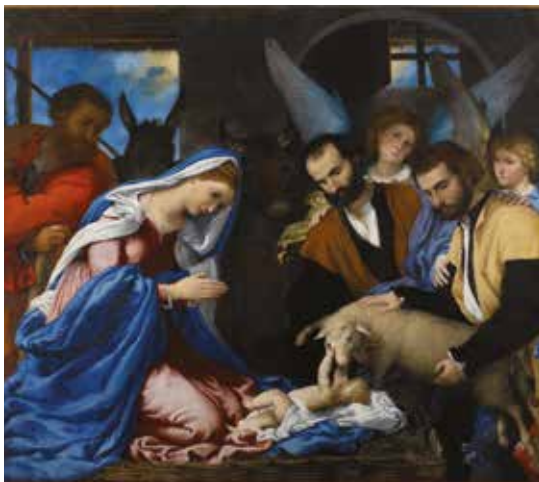
Lorenzo Lotto, Adorazione dei pastori . Brescia, Pinacoteca Tosio Martinengo

5 SETTEMBRE – 2 NOVEMBRE 2014 VENEZIA, GALLERIA DI PALAZZO CINI A SAN VIO