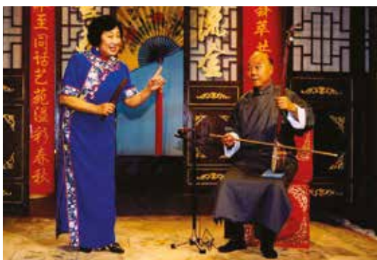
Cantastorie cinesi durante uno spettacolo

del mondo – sia dal punto di vista delle tecniche di fabbricazione, delle forme e della decorazione che da quello del contesto socio-culturale che le ha generate. Si cercherà di definire un corpus di forme e di decorazioni, di evocare la clientela e i committenti di queste opere, grazie in particolare allo studio dell’araldica e dell’emblematica, e infine di rintracciare il loro arrivo sul mercato dell’arte europeo nell’Ottocento, e poi americano nel Novecento. L’origine veneziana di questa produzione verrà discussa e riconsiderata con il contributo delle recenti ricerche archivistiche, dello studio dei ricettari dei vetrai e dei risultati delle indagini fisico-chimiche realizzate dal C2RMF di Parigi, il LAMA di Venezia e l’Opificio delle Pietre Dure di Firenze. Nel corso dei tre giorni di convegno sarà esposto al pubblico lo specchio in rame smaltato della raccolta della Galleria di Palazzo Cini, che è la seconda per importanza dopo quella del Louvre, restaurato per l’occasione dall’Opificio delle Pietre Dure.