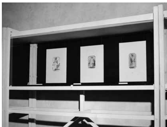
Allestimento della mostra Cento antichi disegni veneziani (6 settembre - 31 ottobre 1955)