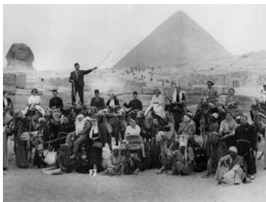
Pellegrinaggio dei laureati cattolici italiani, 20 marzo - 5 aprile 1956. Foto di gruppo davanti alle Piramidi