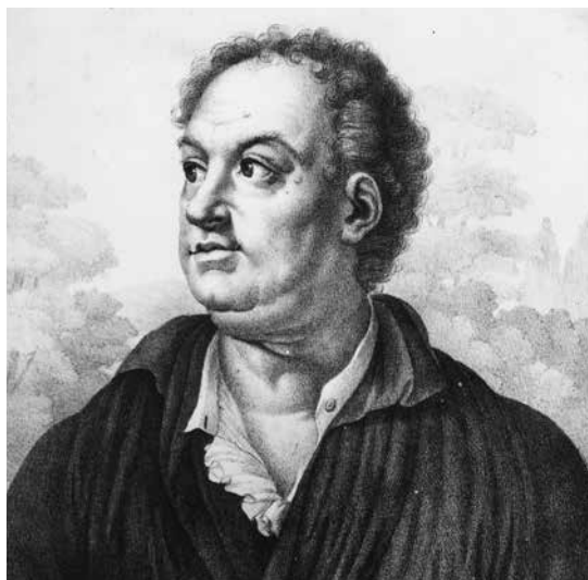
Ritratto di Niccolò Jommelli, litografia

la critica francese, italiana e tedesca del dopoguerra (tenendo conto delle presenze di allora), la Biennale del 1954, il dibattito astratto-figurativo, il Gruppo degli Otto, il ruolo di Severini, l'astrazione americana e le incursioni nella scultura nel dopoguerra, l'Europa degli anni Cinquanta fra Informel /Spazialismo e neoavanguardie e altri focus generati dal convegno. La seconda giornata, organizzata in collaborazione con Palazzo Grassi, consentirà un confronto in merito a problematiche, orientamenti, destini, visioni, progetti legati alla disciplina della storia dell'arte, una sorta di laboratorio critico che possa offrire spunti di riflessione per le politiche culturali; nella stessa occasione sarà presentata una rassegna di documentari d'arte dedicati ad alcuni dei più importanti storici dell'arte del Novecento.