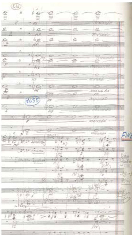
Diario - ultime pagine, partitura autografa, dettaglio

Proprio grazie a una prima indagine sugli autografi delle partiture è stato possibile redigere una più precisa cronologia delle opere. Tra i lavori per il teatro musicale annoveriamo Villon (1941), opera prima del compositore, Diagramma circolare (1959), Paolino, la giusta causa e una buona ragione (1975-1976), Secondatto (1977-1987) e Il Mobile rosso (1988-1990); tra la musica sinfonica la Sinfonia in un tempo (1945-1946), le Variazioni per orchestra (1947), Concerto per il Principe Eugenio (1943-1945 e 1948-1950), Birkenhead (1950-1951), Concerto primo (1960), Secondo concerto (1962), Terzo concerto (1965-1969), Requiem senza parole (1969-1970); tra le opere per solista e orchestra la cantata per tenore e orchestra Viaggio e Finale (1965) e la Fantasia - Recitativo quasi una danza (1980-1981); inoltre il balletto Diario marino (1970-1977) e Diario - ultime pagine (1991-1994), la sua ultima composizione; infine la Messa per la Missione di Nyondo (1951), eseguita nuovamente in occasione dell'atto di dona-