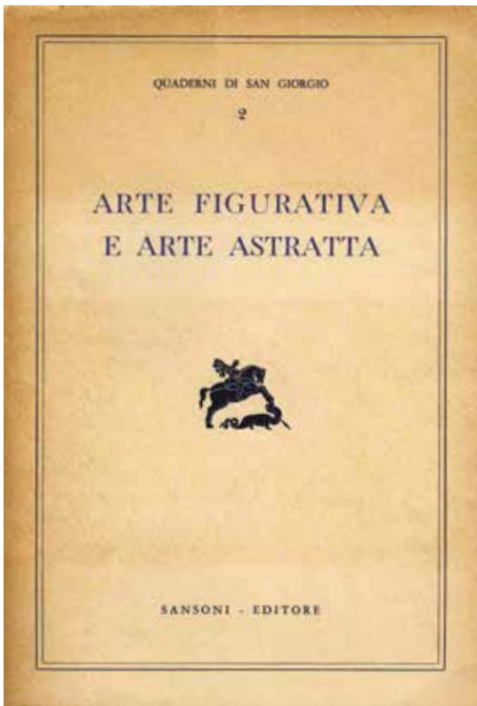
«Quaderni di San Giorgio» Arte figurativa e arte astratta , Sansoni Editore, Firenze, 1955

lo spessore e l'importanza di quello storico convegno, dedicandogli la prima edizione delle Giornate di studi di storia dell'arte . La prima giornata verterà sullo stato della critica d'arte, in riferimento ai protagonisti e alle voci dello storico consesso del 1954 – intervennero, tra gli altri, Gino Severini, Enrico Prampolini, Emilio Vedova, Felice Carena, Berto Lardera – e sulle principali tematiche che furono messe a fuoco in quell'occasione, con l'obbiettivo di disegnare il perimetro e i confini storiografici che seguirono e le prospettive critiche attuali, e sottesa vi è l'ambizione di istituire una trama di confronti sullo stato attuale delle metodologie della ricerca storico-artistica sulle arti e la critica del Novecento. Alcuni degli argomenti riguarderanno