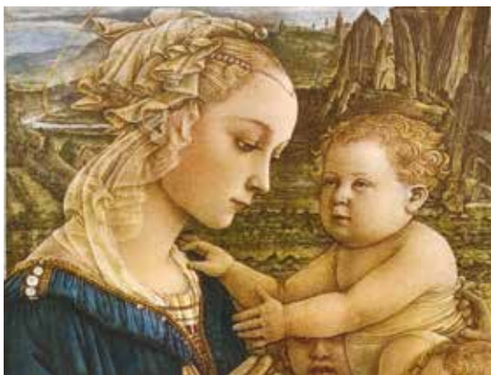
Filippo Lippi, Madonna con Bambino .

La Galleria di Palazzo Cini è aperta al pubblico grazie al sostegno di Assicurazioni Generali.