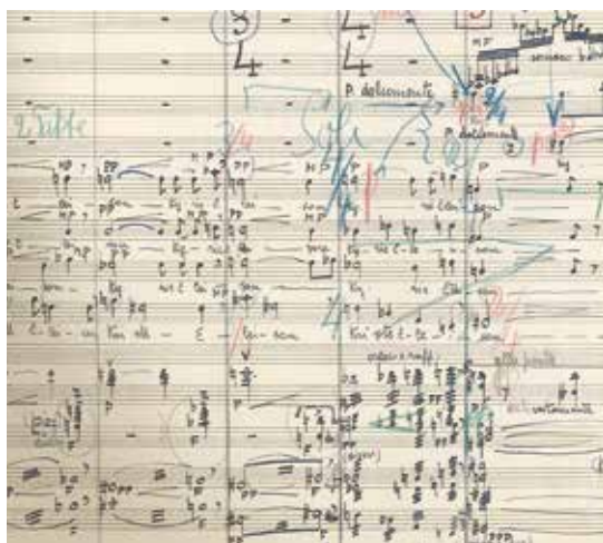
Estratto da Kyrie, Messa per la Missione di Nyondo (1951), manoscritto

rotazione del diagramma dura 25 anni, dal 1920 al 1945. La figura chiave dell'opera è il narratore, il Conferenziere, che rompe lo spazio scenico convenzionale perché appare sempre a una delle due estremità del boccascena, seduto a una scrivania con una caraffa d'acqua e un bicchiere, mentre si rivolge al pubblico e inizia a narrare la storia spiegando la funzione del diagramma e il ciclo delle congiunture economiche. Laddove Diagramma s'interrompe, inizia Secondatto , che si caratterizza per una struttura più codificata e orientata al teatro musicale tradizionale – mi riferisco alla suddivisione in atti e scene – rispetto al flusso continuo dell'opera precedente. Entrambe gravitano nel campo della tonalità allargata, ma è soprattutto Diagramma circolare ad affrontare in maniera sperimentale la relazione tra canto e prosa. Quanto mai interessante il soggetto scelto: l'industria, generalmente intesa come espressione della modernità e del progresso, che qui si manifesta nella sua realtà di fautrice di distruzione della società stessa.