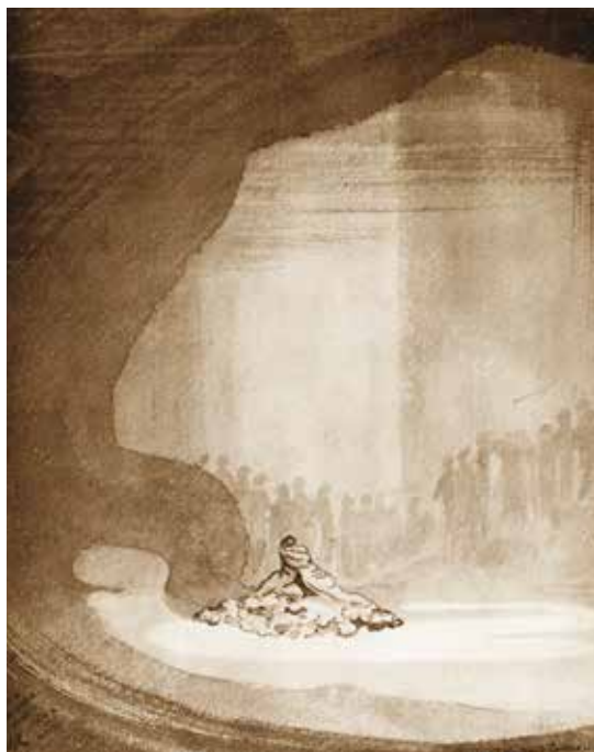
Edward Gordon Craig, bozzetto per la prima scena del secondo atto di Acis and Galatea di Händel, Londra, 1902

5 – 6 DICEMBRE 2014 VENEZIA, ISOLA DI SAN GIORGIO MAGGIORE