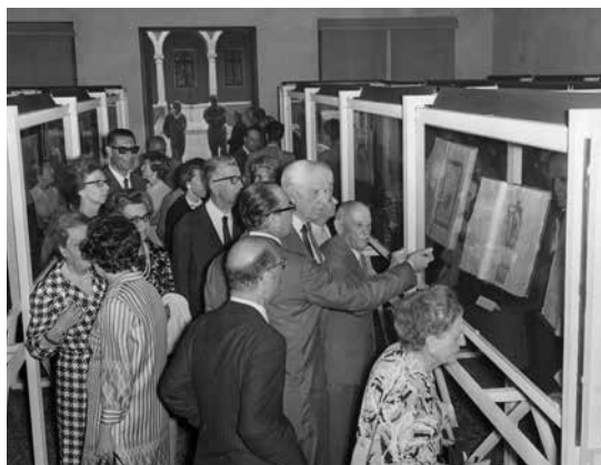
Inaugurazione della mostra Caricature di Anton Maria Zanetti (12 luglio - 15 ottobre 1969)