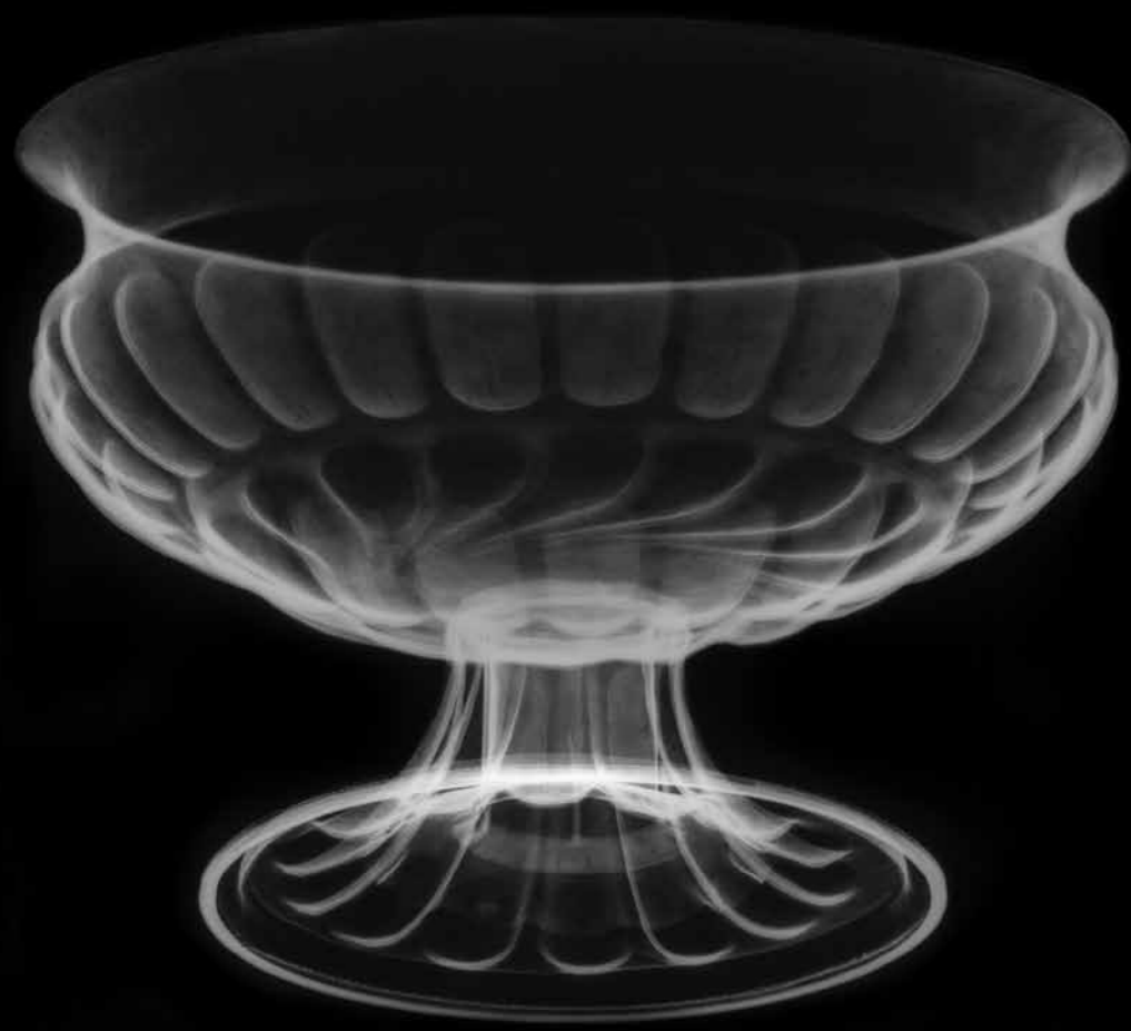
Coppa, inizio del XVI secolo, radiografia. Parigi, Musée du Louvre © C2RMF / Anne Maigret.