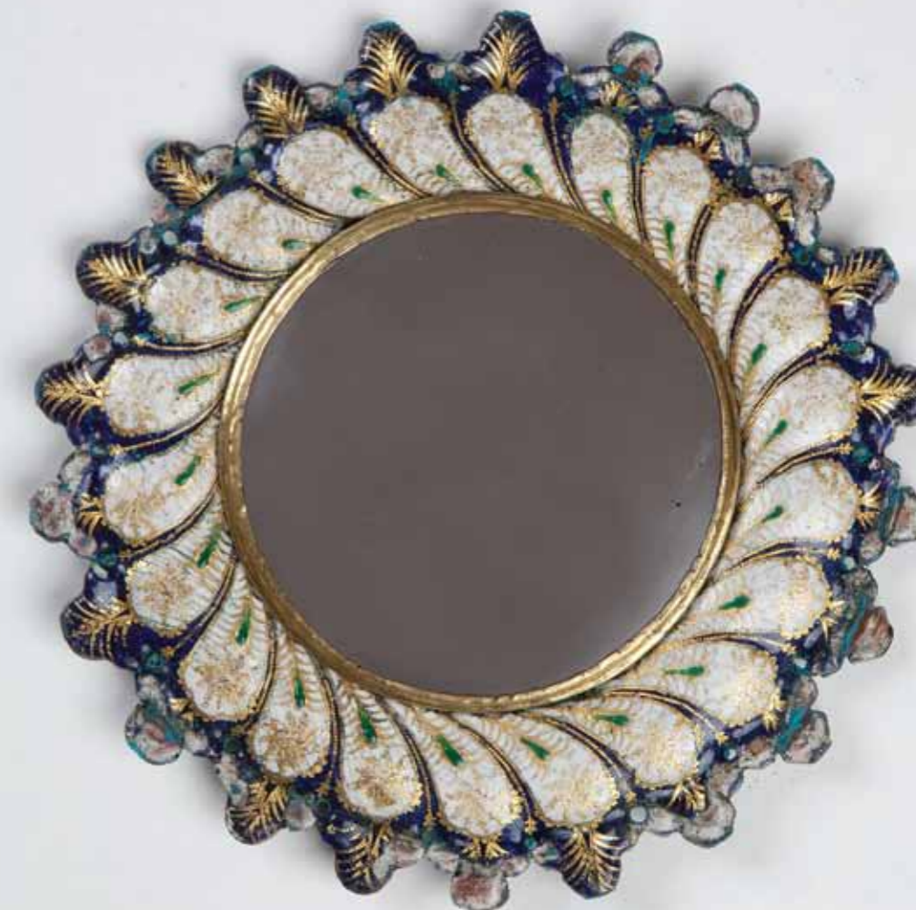
Specchio, fine del XV secolo. Venezia, Galleria di Palazzo Cini.